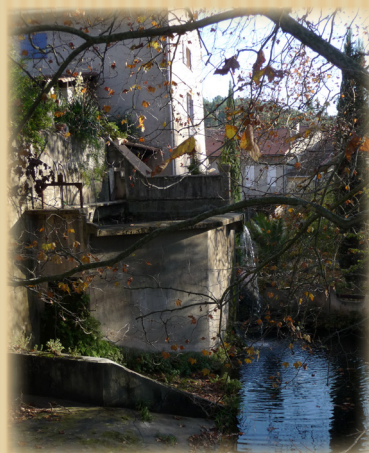
Fig 1 : Le moulin de Pont de Joux